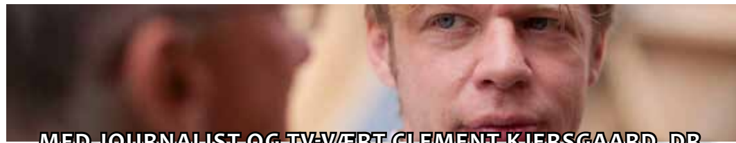
MED JOURNALIST OG TV-VÆRT CLEMENT KJERSGAARD, DR.

I 30-året for Murens fald er verden omkring Danmark igen i forandring, men de færreste tør tro på at udviklingen går i den rigtige retning. Tværtimod er mange - også herhjemme - begyndt at frygte fremtiden.